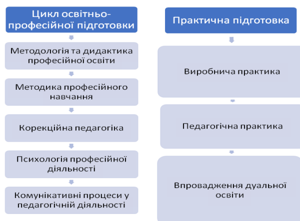
Рис. 2. Зміст навчальних блоків спеціалізації «Професійна освіта»

Зміст навчальних блоків спеціалізації «Професійна освіта» представлений на рис. 2.