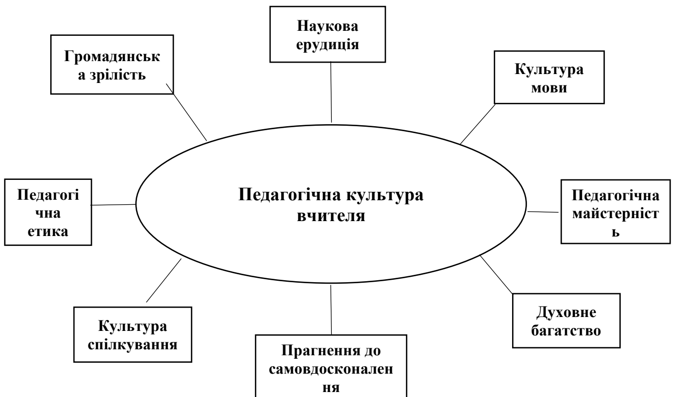
Рис. 1.2. Компоненти педагогічної культури вчителя, які є важливими для успішної освітньої діяльності

Розмаїтість поглядів вчених і дослідників на педагогічну культуру, що була висвітлена у попередньому розділі, призводить до різних підходів у структуруванні цього поняття, тобто до визначення основних складових та компонентів. Наприклад, у підручниках і навчальних посібниках з педагогічних дисциплін компоненти педагогічної культури вчителя можна представити у вигляді схеми, запропонованої А. Рацулом.