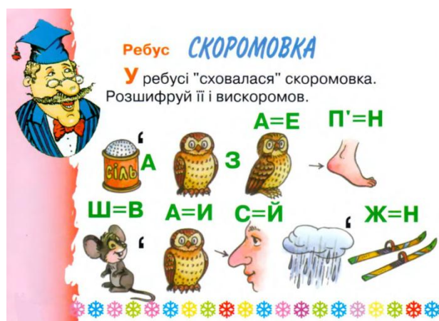
Рис. 1. Завдання з журналу "Барвінок"