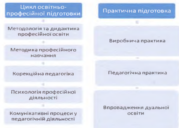
Рис. 2. Зміст навчальних блоків спеціалізації «Професійна освіта»

Зміст навчальних блоків спеціалізації «Професійна освіта» представлений на рис. 2.