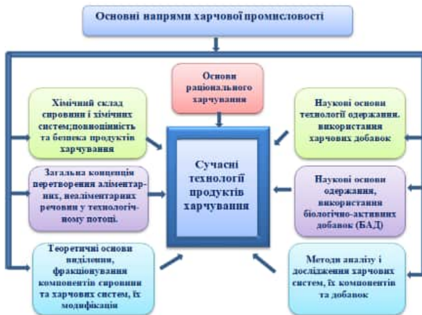
Рис. 1. Основні напрями харчової хімії (розроблено за [3])

Наведемо деякі приклади. Сіль, сода і прянощі відомі людям з давніх часів, проте справжній розквіт їхнього використання почався у ХХ столітті – столітті харчової хімії. На добавки були покладені великі надії. І вони виправдали очікування. Завдяки їх використанню вдалося створити великий асортимент апетитних, стійких до псування, менш трудомістких у виробництві продуктів. Здобувши визнання, «поліпшувачі» були поставлені на конвеєр. Ковбаси стали ніжно-рожевими, йогурти свіжофруктовими, а кекси пишно-нечерствими. «Молодість» і привабливість продуктів забезпечили саме добавки, які використовують як барвники, емульгатори, ущільнювачі, згущувачі, желеутворювачі, глазурувачі, підсилювачі смаку і запаху, консерванти. Все це асоціюється з терміном «харчові добавки».