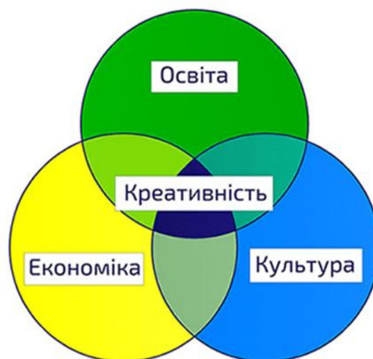
Рис. 1.1 Креативність: взаємодії

Однак дослідники інтелекту давно дійшли висновку про слабкий зв'язок творчих здібностей із здібностями до навчання та інтелектом (Л. Терстоун), оскільки творче мислення не зводиться до дивергентного мислення, воно також включає чутливість до проблем, здатність до перевизначення та ін.